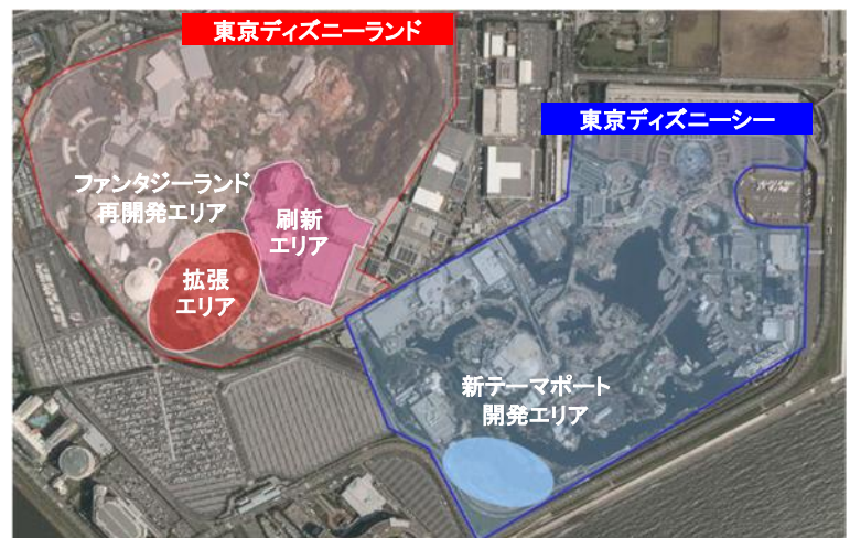
2 パーク大規模開発エリア

※画像は現時点での構想段階のもので、今後変更になる場合があります