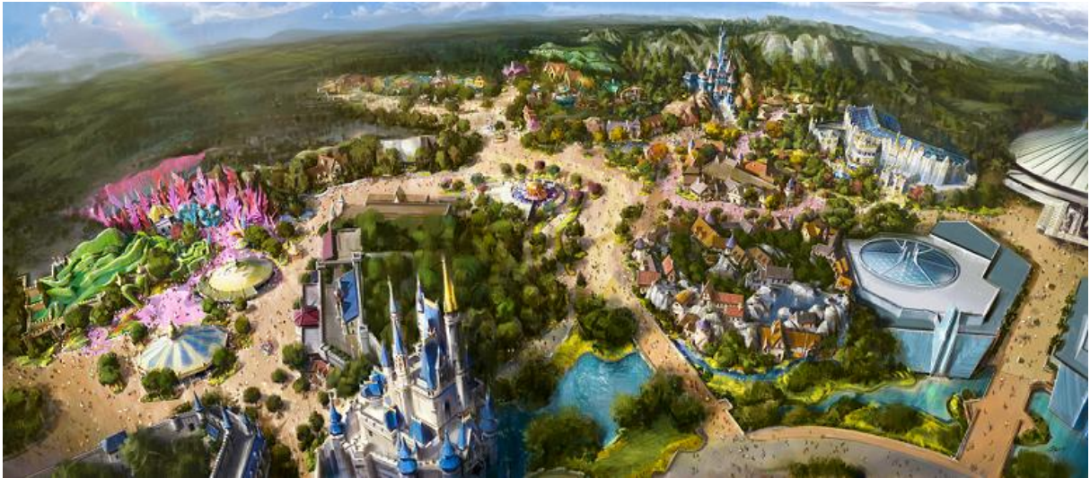
東京ディズニーランド 「ファンタジーランドの再開発」エリア