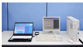
歯科レセコン モリタ社製(DOC-5J)