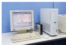
医科レセコン Panasonic 社製 (Medicom)