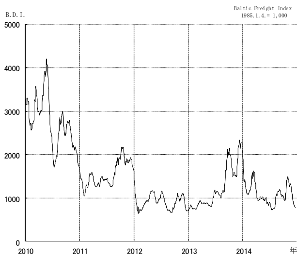
不定期船運賃 BDI (BFI) の推移