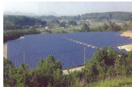
＜ABL実績の事例＞ 太陽光設備