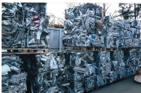
＜ABL実績の事例＞ スクラップ