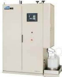
クレベリン発生機 リスパス NEO