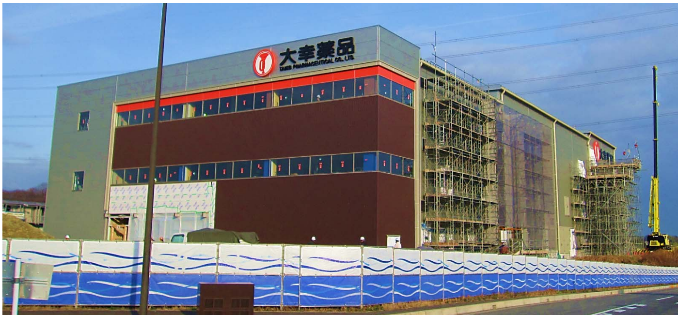
建設中の新工場(2015年1月時点)