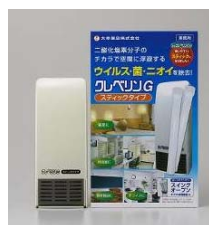
クレベリンG スティックタイプ