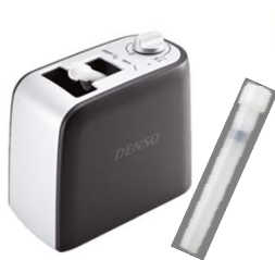
DENSO 車両用クレベリン