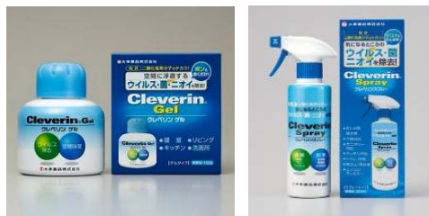
クレベリン ゲル クレベリン スプレー