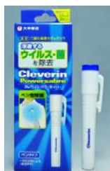
クレベリン パワーセイバー