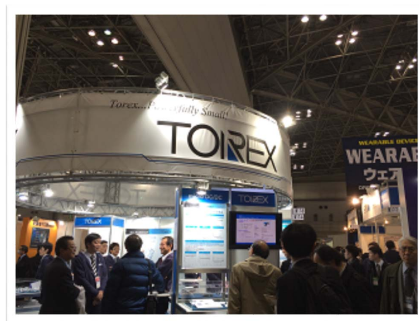
「第1回ウェアラブルEXPO」