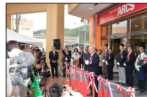
2014年7月 スーパーアークス 室蘭中央店 開店