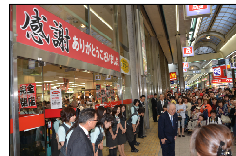
2014年6月 プラザ札幌店 閉店