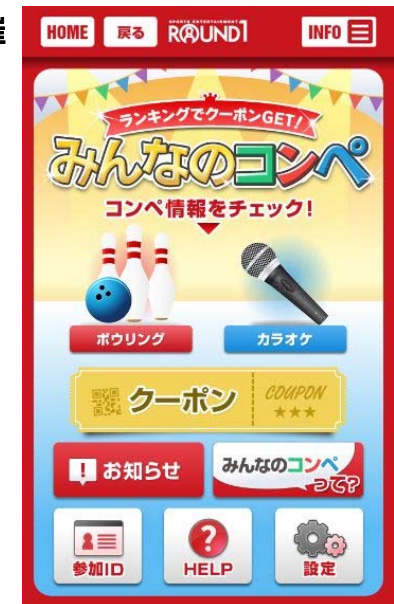
【みんなのコンペ】イメージ図