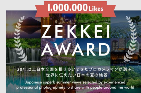
2015/6 プロカメラマンが世界に伝えたい日本の絶景を選出する「ZEKKEIアワード」を発表