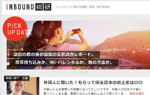
2015/5 インバウンドにまつわる調査データを公開する「インバウンド総研」を創設