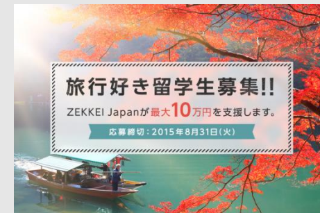
2015/7 外国人留学生に国内旅行資金の支援を行う「奨“旅”金制度」を開始