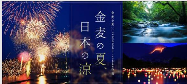
2015/6 サントリービール(株)の「金麦」の夏の企画と連携し、日本の花火の絶景を紹介する「金麦の夏×ZEKKEI Japan」特設ページを開設