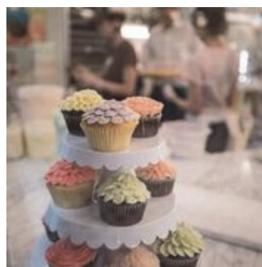
『マグノリアベーカリー表参道』(平成26年6月16日オープン)