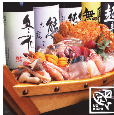
札幌で複数店舗のレストランを運営