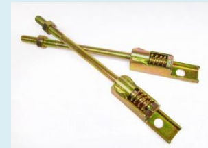
三栄式羽子板ボルト

デザインカの向上、及び社会全体へ三栄の 商品価値をアピールしていくために、 今後も日本デザイン振興会の 「グッドデザイン賞」受賞を目指します。