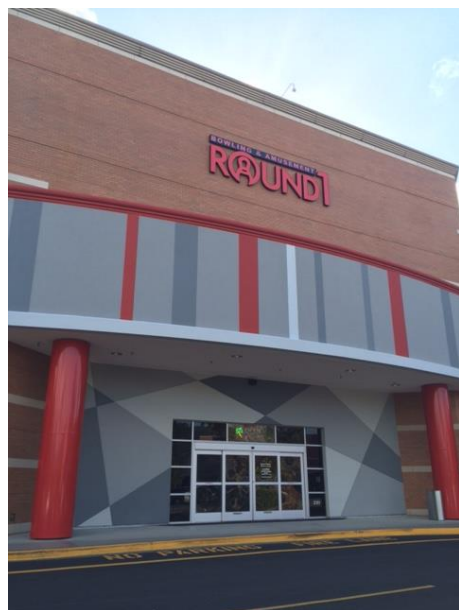
ラウンドワン シアトル・サウスセンター店 米国ワシントン州シアトル 2015年7月3日 オープン！