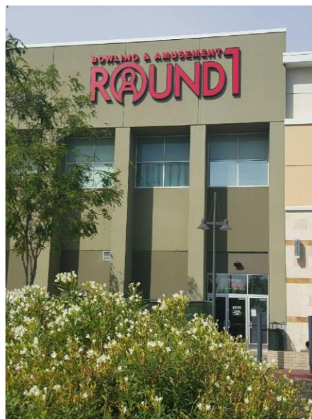
ラウンドワン サンノゼ・イーストリッジ店 米国カリフォルニア州サンノゼ 2015年9月4日 オープン！