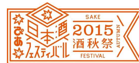
●ぴあ日本酒フェスティバル2015 酒秋祭 http://www.pia-sakefes.com/