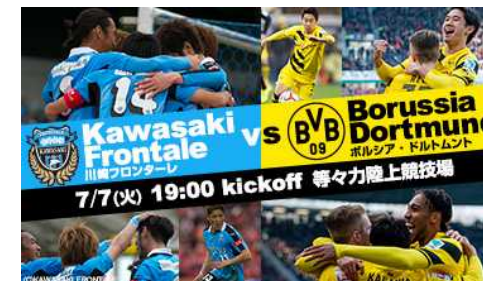
●Dortmund Asia Tour 2015 川崎フロンターレ vs ボルシア・ドルトムント https://www.jleague-ticket.jp/topics/2015/05/0519_01