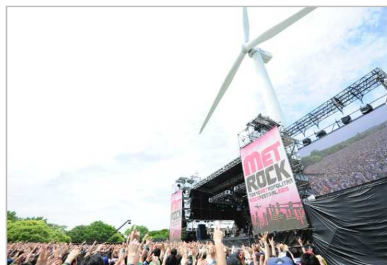
●TOKYO METROPOLITAN ROCK FESTIVAL 2015 http://metro.rock.jp/