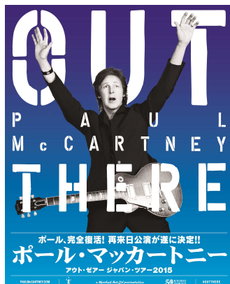
●ポール・マッカートニー 「アウト・ゼア ジャパン・ツアー2015」 http://t.pia.jp/feature/music/paulmccartney/