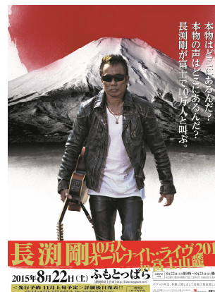
●長渕剛 10万人オールナイト・ライブ 2015 in 富士山麓 http://nagabuchi2015.com/