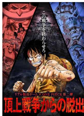
●リアル脱出ゲーム×ONE PIECE第二弾 「頂上戦争からの脱出」 http://realdgame.jp/onepiecetour/