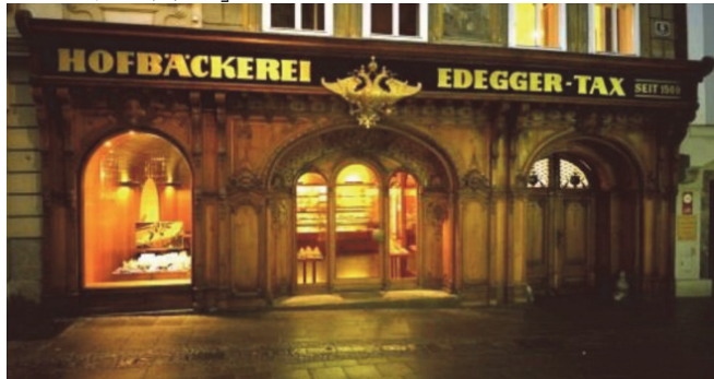
「オーストリア本店」