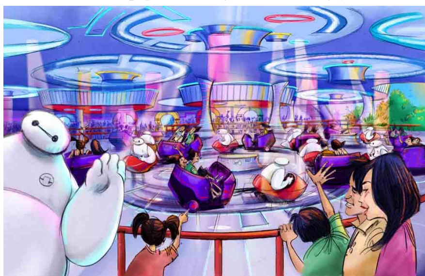
『ベイマックス』をテーマにした新アトラクションの体験シーン