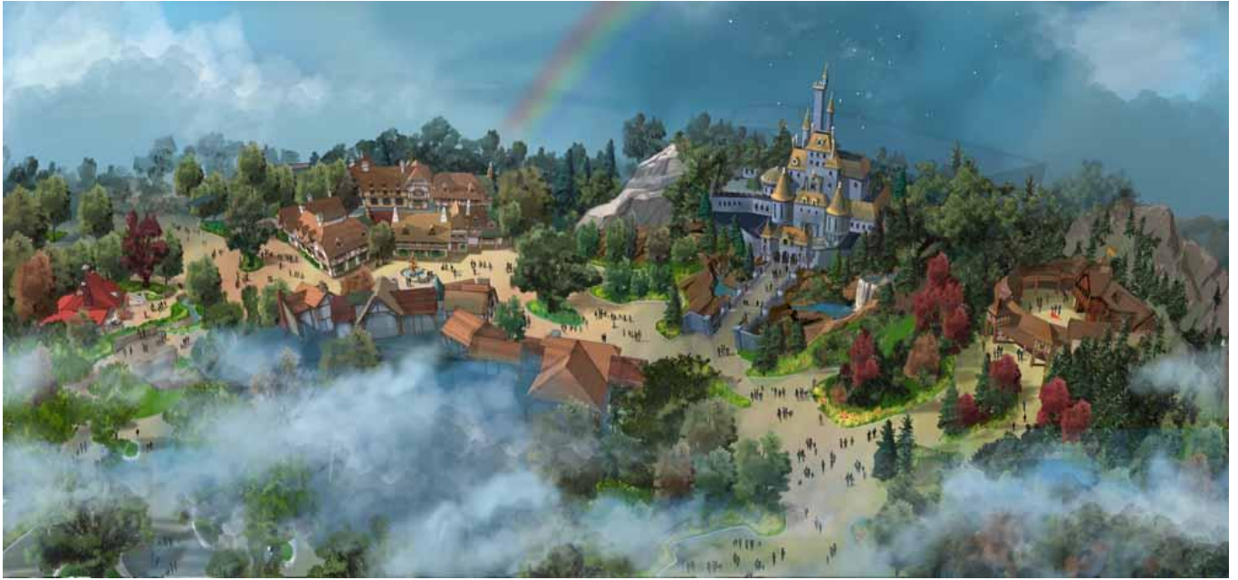
「美女と野獣エリア（仮称）」の街並み