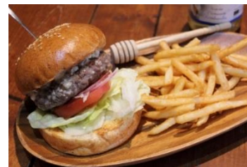
<クラシックバーガー>