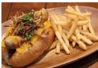
<オリジナルホットドッグ>