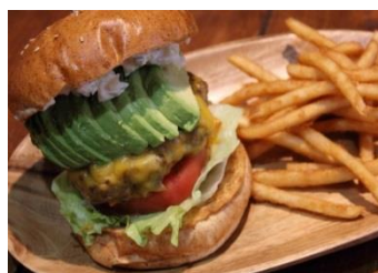
<アボカドチーズバーガー>