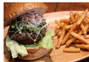
<香味てりやきバーガー>