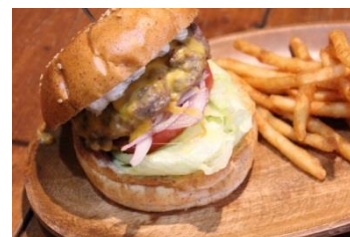
<チェダーチーズバーガー>

※写真はいずれも、+400円のフレンチポテトフライとドリンクのセットのものととなります。