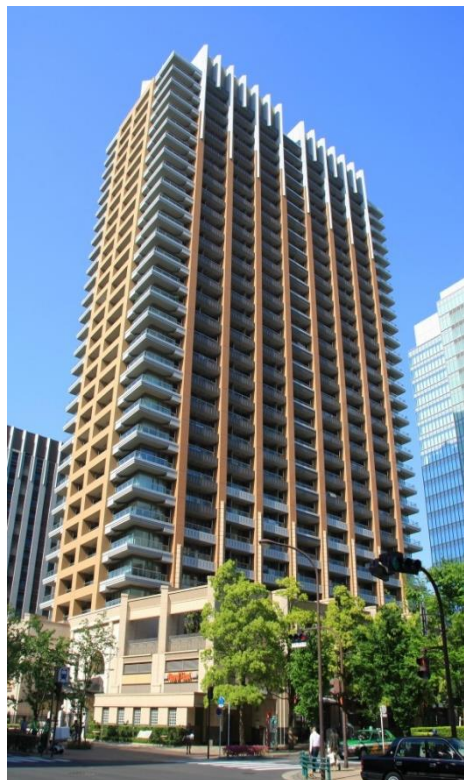
東京パークタワー