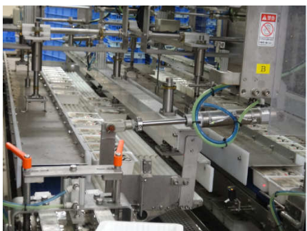
ボイル&クール槽（殺菌工程）