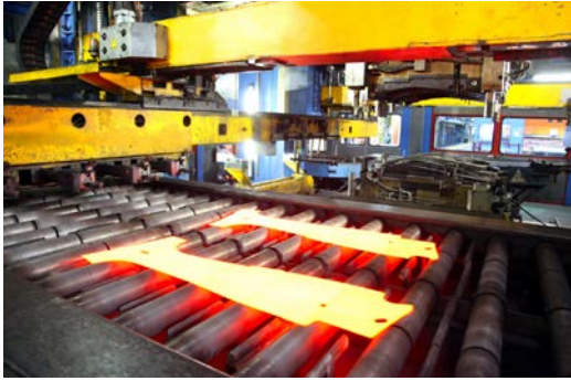
自動車の軽量化を通じ、地球環境にも貢献する GA 社のホットスタンピング技術