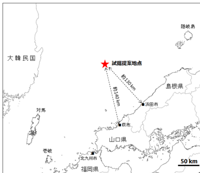
基礎試錐の掘削地点