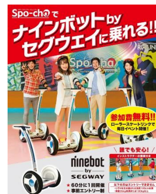
『ninebot by SEGWAY』