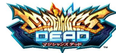
『マジシャンズデッド』