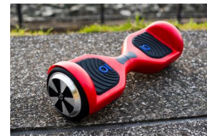
『バランススクーター』