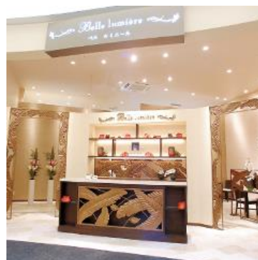
イオンモール土浦店