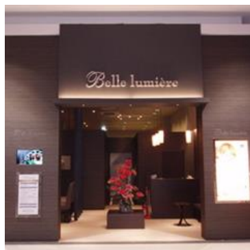
イオンモール名取店