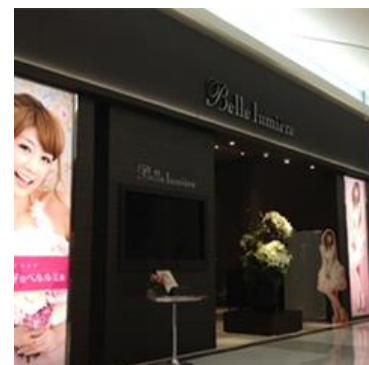
イオンモール高松店