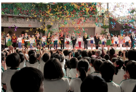
震災後のグランドオープン(2012年2月)