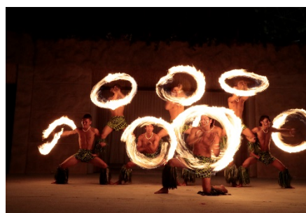
ファイヤーナイフダンスチーム「SivaOla」発足(2016年7月)