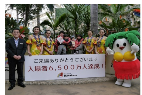
累計入場者数6,500万人達成(2017年1月)