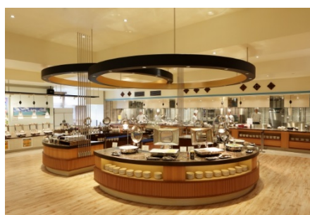
パシフィック オープン(2016年4月)