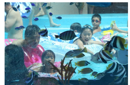
フィッシュゴーランド オープン(2015年7月)