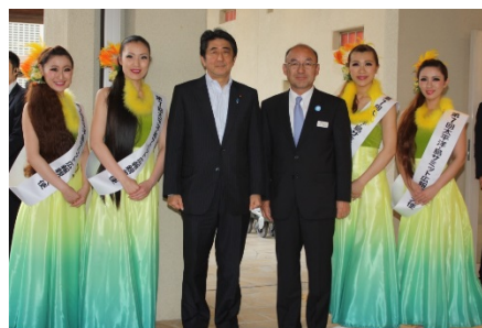
第7回太平洋・島サミット(2015年5月)