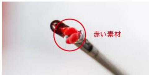
心臓右心室中隔から採取した組織