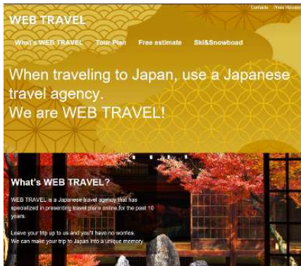
(ウェブトラベルのインバウンド用ウェブサイト)

関心が高まっており、今後も一層力を入れてまいります。また、その取組みの一環として、パラアスリート協会及び株式会社実業之日本社の協力のもと、パラスポーツ専門誌の発刊なども視野に入れ、障がい者スポーツの認知の拡大と普及に注力してまいります。