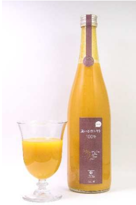
黄いろのトマト100%ジュース

また、トマトを使用した新商品の開発に注力しており、高齢者向けのソフト食としてトマトのレアチーズケーキを開発し、介護施設向けに納品を開始しております。