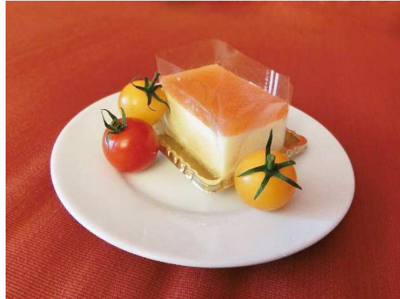
トマトのレアチーズケーキ

「フランチャイズ事業」では、企業向けにパッケージ販売を行い、2016年11月にはシステム導入先の圃場で収穫が開始されました。また、自社圃場におきまして定期的に、特許農法と農業ICTの説明会を開催しており、地方自治体や学校法人から研修の一環として活用されるなど全国各地からの見学や問い合わせをいただいております。