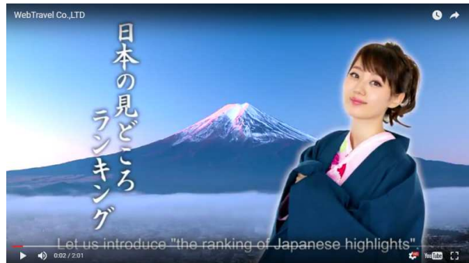
(左記サイト内の動画トップページ)

「トラベルコンシェルジュ」の登録数も順調に推移しており、コンシェルジュが旅行以外の特技を生かせる場として、クラウドソーシング事業を展開し、優秀な人材確保に努めております。具体的には、親会社であるフィスコの情報配信業務や株式会社フィスコIRのIRニュースのショートコメントの作成、およびインバウンド専用ページでの翻訳業務など、コンシェルジュの特技を生かした様々な業務を委託することで、帰属意識を高める施策として今後も取り組んでまいります。