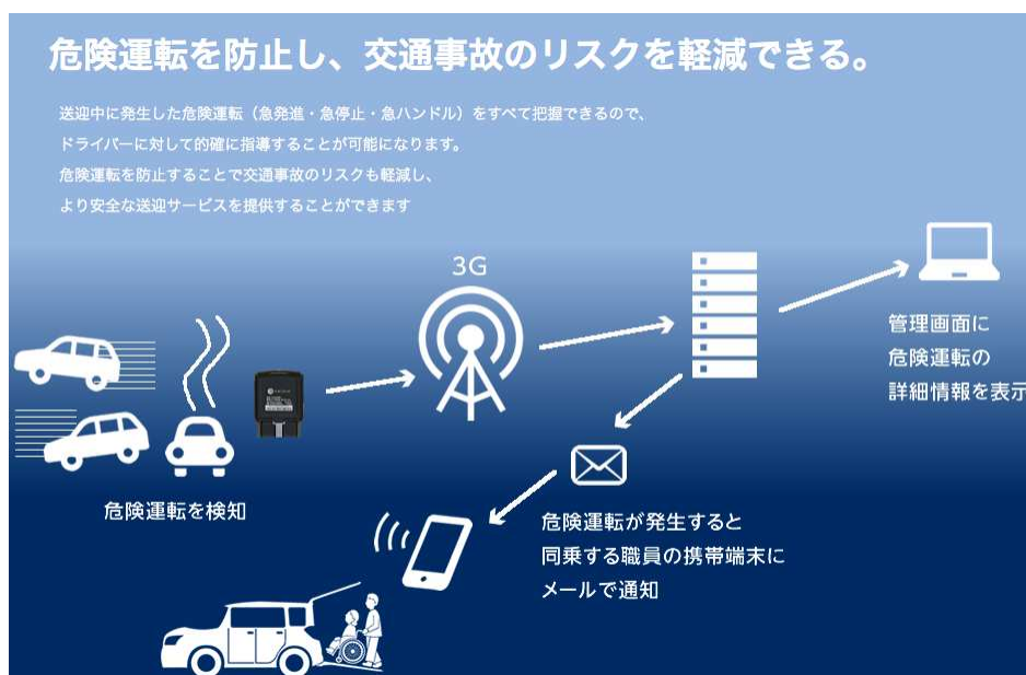
安全運転支援サービス「Drive Care」