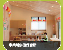
事業所併設保育所