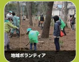
地域ボランティア

※当社は 2017 年 1 月 25 日付けにて DIC 株式会社と資本業務提携契約を締結いたしました。 プレスリリース http://www.taiyo-hd.co.jp/_cms/wp-content/uploads/2017/01/20170125_02.pdf