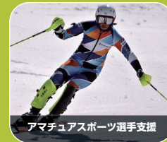
アマチュアスポーツ選手支援