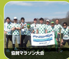
協賛マラソン大会