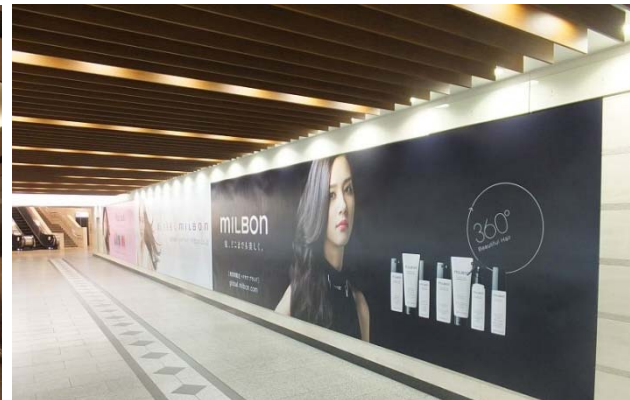
阪急梅田 動く歩道付近