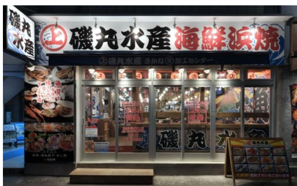
磯丸水産 渋谷新南口店