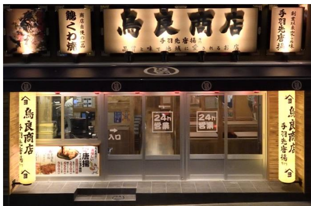
鳥良商店 新宿区役所前店