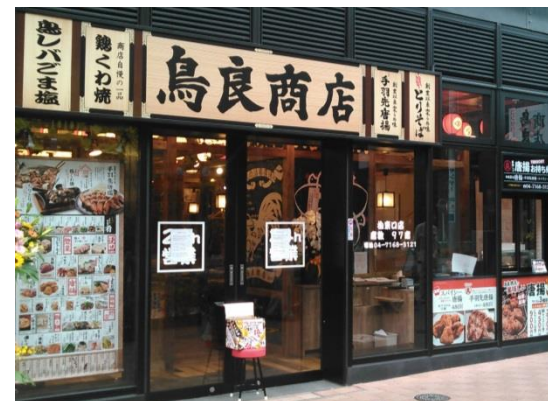
鳥良商店 柏東口店