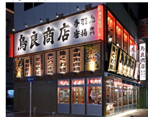
鳥良商店 伊勢佐木町店