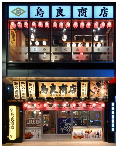
鳥良商店 北千住東口店