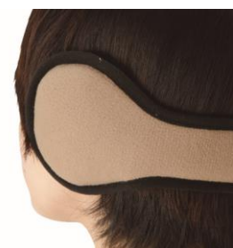
ヘアスタイルが崩れにくい バックアーム式