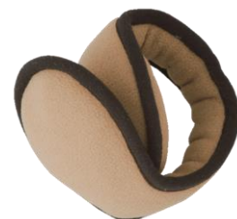
コンパクトに折りたたみ可能