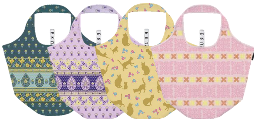
【プロヴァンスネイビー】 【キャットグレージュ】 【プロバンスパープル】 【ハワイアンピンク】

デザイン:プロヴァンスネイビー、プロバンスパープル、キャットグレージュ、ハワイアンピンク