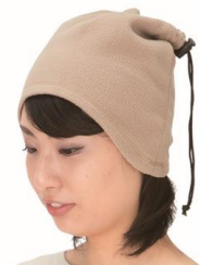
紐を締めると帽子に！