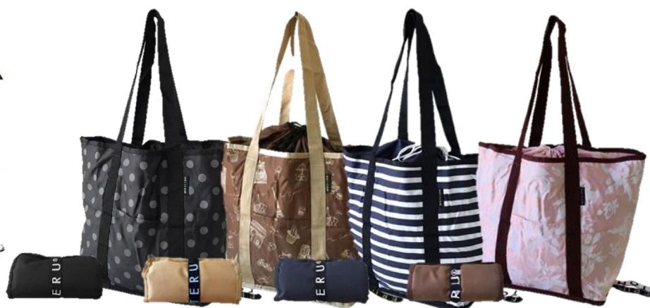
【ドットブラック】 【ボーダーネイビー】 【フレンチブラウン】 【フラワーピンク】