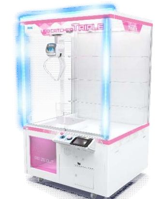
『UFOキャッチャートリプル』