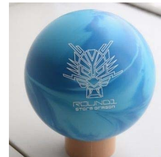
『キッズ用マイボール』