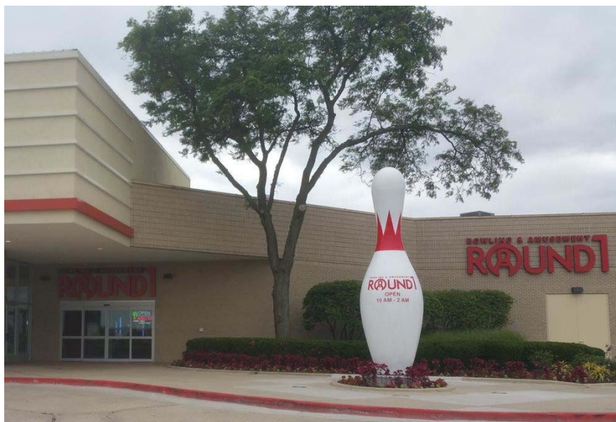
ラウンドワンフォックスバレー店 米国イリノイ州オーロラ 2017年3月31日オープン!