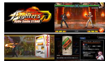
▲「THE KING OF FIGHTERS D～DyDo Smile STAND～」の画面イメージ

また、当社初となるスマートフォン向けゲームアプリの開発を記念して、登録総数に応じてプレイヤー全員がゲーム内コインやアイテム等もらえる事前登録キャンペーンを「DyDo Smile STAND」アプリで8月10日(木)よりスタートしています。