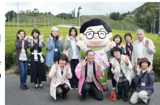
お客様との交流イベントのお茶摘み体験にて集合写真

健康や美容をテーマとしたお客様向けセミナーや弊社社員とお客様の座談会など他の通販会社ではやらないようなイベントを企画・運営し、ブランドの浸透を図るとともに、お客様との絆づくり活動を推進します。