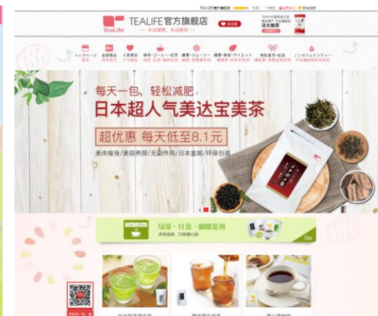
TEALIFE官方旗舰店 (JD Worldwide)