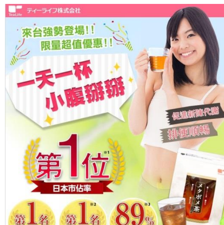
台湾でのWEB広告ページ

台湾において売上は順調に推移しており、今後の事業拡大のため先行投資を行う予定です。 台湾での展開が軌道に乗り次第、ベトナムなど東南アジアへの進出も計画しています。