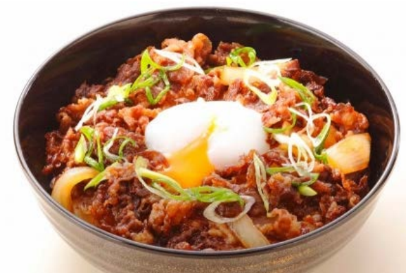
〈柿安名物 牛肉しぐれ煮丼〉