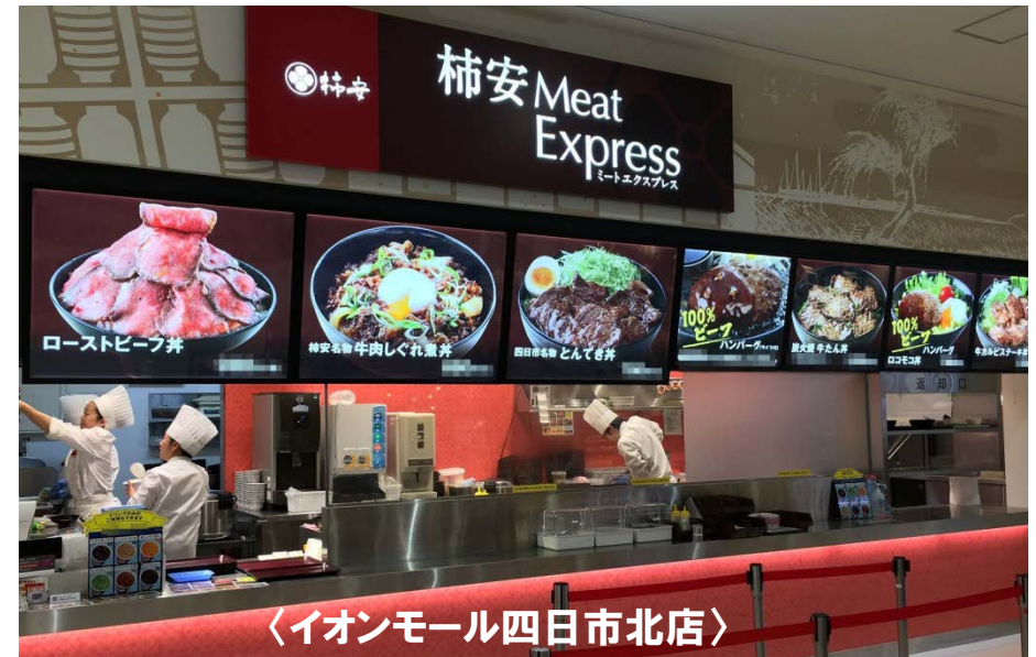
〈イオンモール四日市北店〉