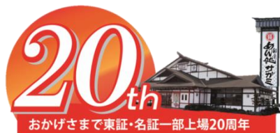
東証・名証一部上場20周年ロゴ