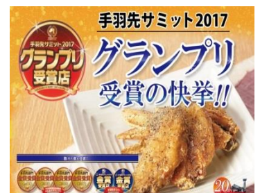
手羽先サミット2017グランプリ受賞