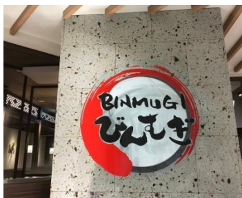
『びんむぎセレオ八王子店』