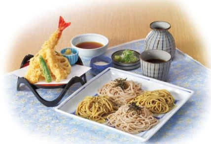
『満天きらりの韃靼そばと石挽そば』

2017年6月9日から3日間、名古屋市中区久屋大通公園で開催された「手羽先サミット2017」にて、サガミの手羽先が最高賞であるグランプリを受賞いたしました。当社の主力一品料理である「なごやめし」の代表格の手羽先は、ブランド力向上に欠かせない商品として位置付けております。今回、グランプリを受賞したことにより、からあげグランプリと手羽先グランプリで通算、6つの金賞と1つのグランプリを受賞いたしました。