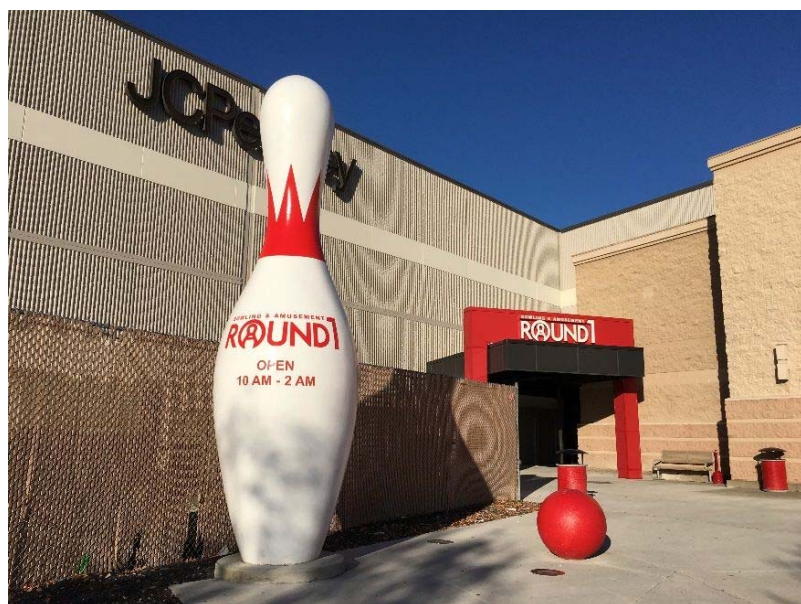
ラウンドワン クリスタルランガレリア店 米国ニューヨーク州 2017年9月30日オープン!