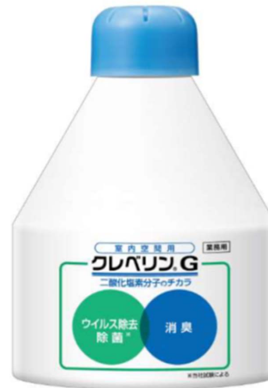
クレベリンG大空間用