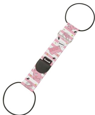
【バーバパパ バッグとめるベルト】