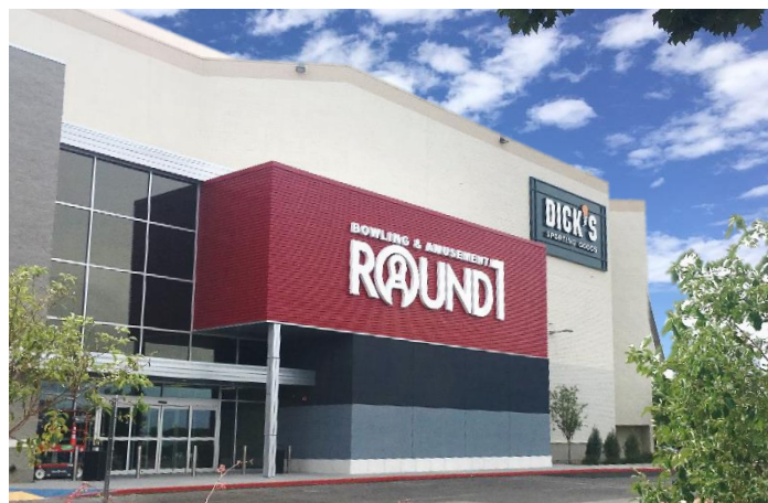
ラウンドワン コロナドセンター店 米国ニューメキシコ州アルバカーキ 2018年6月30日オープン！