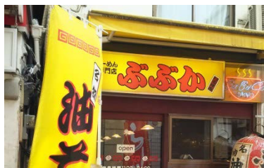
『ぶぶか 吉祥寺北町店』