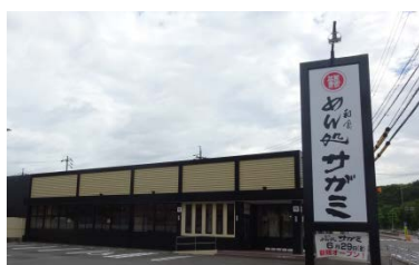
『和食麵処サガミ 東海店』