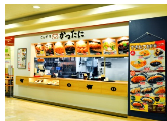
『かつたに アピタ四日市店』