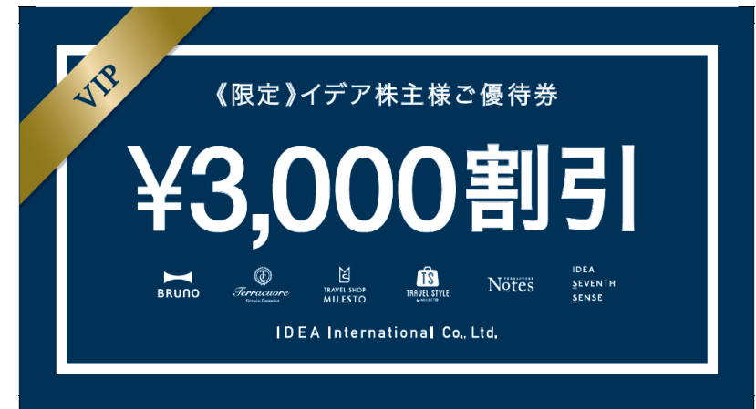
イデアインターナショナル直営店 3,000円割引券