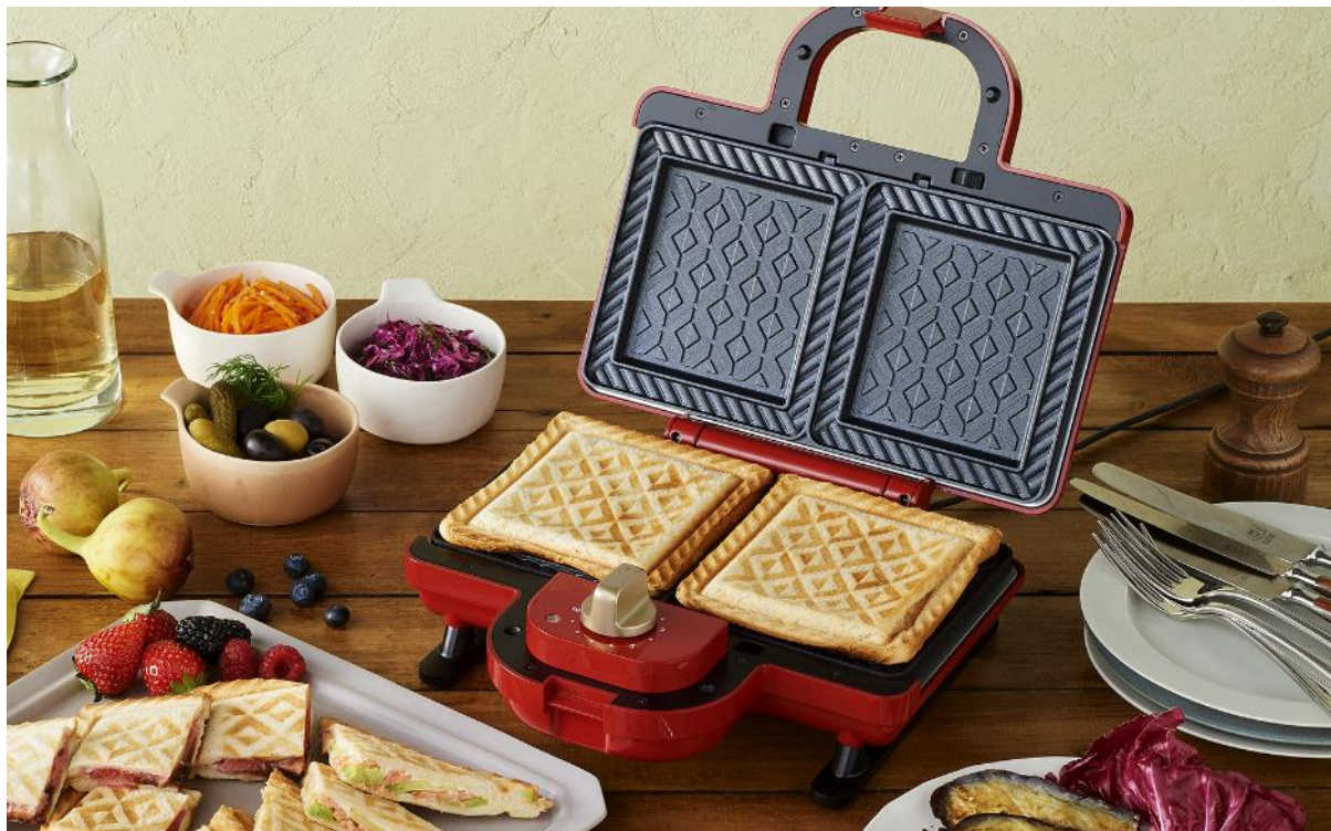
ホットサンドメーカーダブル ¥(税抜8,000)