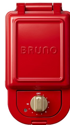
ホットサンド メーカー シングル ¥(税抜5,000)