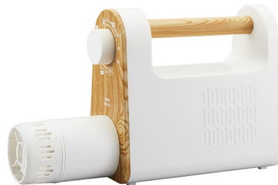
〈BRUNO マルチふとンドライヤー〉