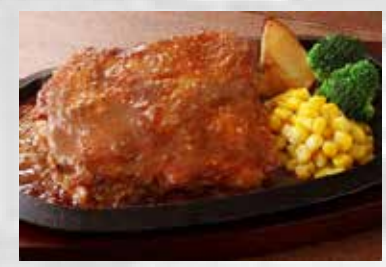
若鶏のうまいまい焼き