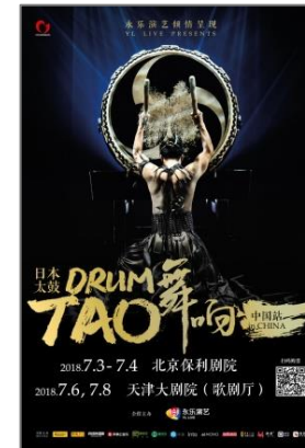
◆DRUM TAO 舞響 (北京、天津)

・ 昨年6月に就任した女性取締役を中心に、当社女性へのグループピアリングを実施。