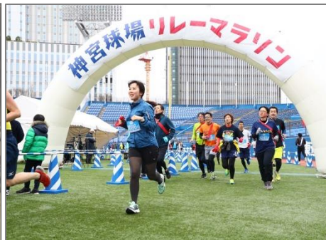
◆ 神宮球場リレーマラソン