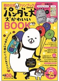
◀人気書籍『パンダと犬』の期間限定グッズショップ