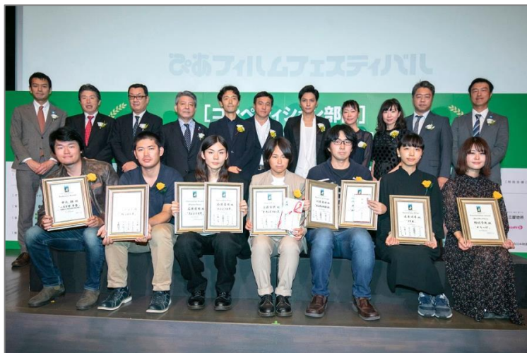
▲第40回PFFの授賞式の模様