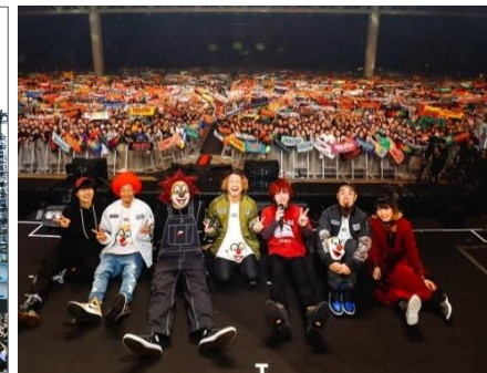
◆ au x PIAの 「uP!!!FESTIVAL2018」