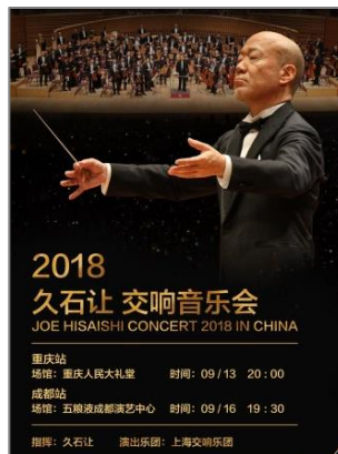
◆久石譲コンサート (重慶、成都)