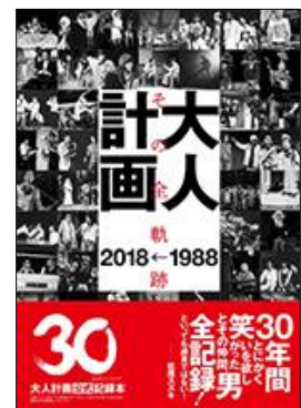
◆大人計画創設30周年記念本