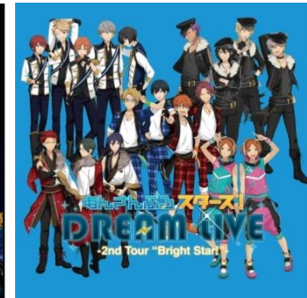
◆ あんさんぶるスターズ! DREAM LIVE