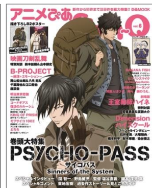
◆アニメぴあ Shin-Q vol.6