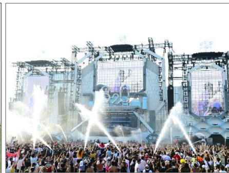
◆ S20 Japan Songkran Music Festival