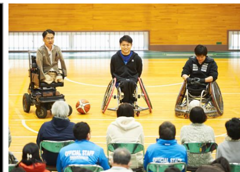
Vol.20 乙武洋匡さん (福島)