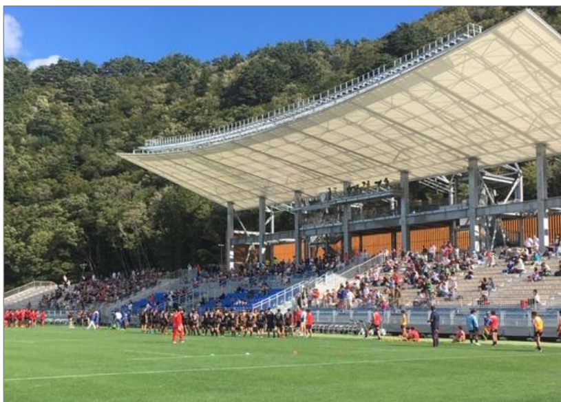
▲2018年8月の「釜石鵜住居復興スタジアム オープニングDAY」の様子

「ラグビーW杯2019」、「2020東京オリンピック・パラリンピック」の開催に向け、チケット販売業務を全面的に受託。