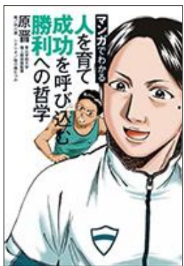
◆青学原晋監督初のコミカライズ本