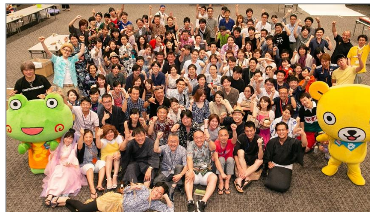
▲2018年7月の全社イベント「創業記念祭」

そこでの課題についてプロジェクト化を見据えた活動を継続するほか、残業時間の抑制、有給休暇の消化率アップのための施策も推進