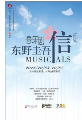
◆東野圭吾原作「手紙」ミュージカル(上海)