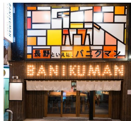
長野といえば、バニクマン