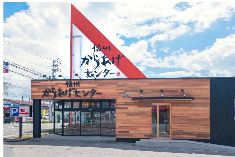
からあげセンター