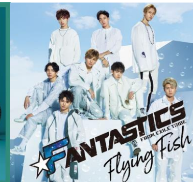
FANTASTICS from EXILE TRIBE