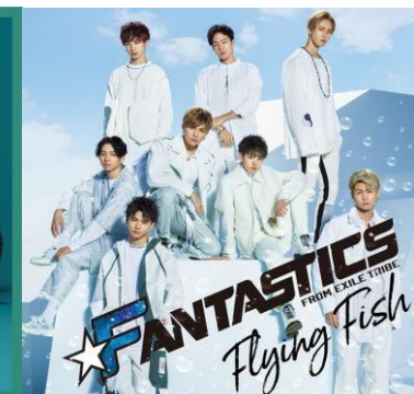
FANTASTICS from EXILE TRIBE