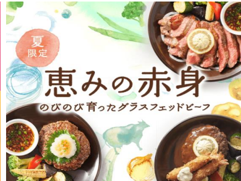
ジヨナサン：フェアメニュー 恵みの赤身