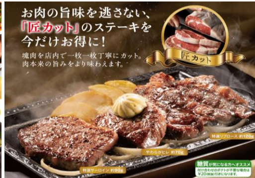
ステーキガスト 恵みの赤身