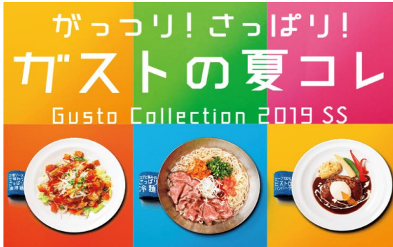
ガスト：フェアメニュー 夏コレ