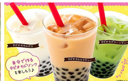
しゃぶ葉：タピオカ食べ放題