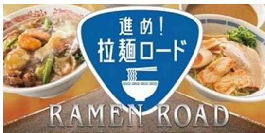
バーミヤン：フェアメニュー 進め！拉麺ロード