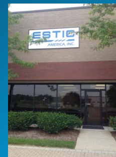
ESTIC AMERICA Inc