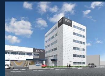
本社・東郷事業所