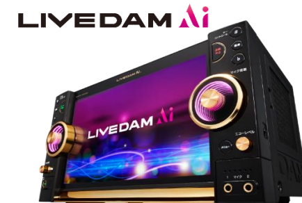
『LIVE DAM Ai』© 第一興商

・既存のスタンダード店舗へスポッチャを併設し、12月に一斉オープン予定。 (対象店舗 : 武蔵村山店 / 習志野店 / 松山店 / 津高茶屋店)