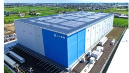
各種環境設備を導入した三井倉庫（株）関東P&Mセンター

倉庫の屋上緑化や太陽光パネル設置、ならびに低公害車の導入や社用車の電気自動車への切り替えにより、CO 2 排出量の削減に貢献しております。