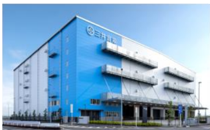
CASBEEのランクA取得、環境配慮型の三井倉庫（株）南本牧倉庫